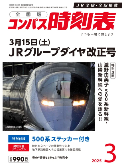
『コンパス時刻表』2025年3月号