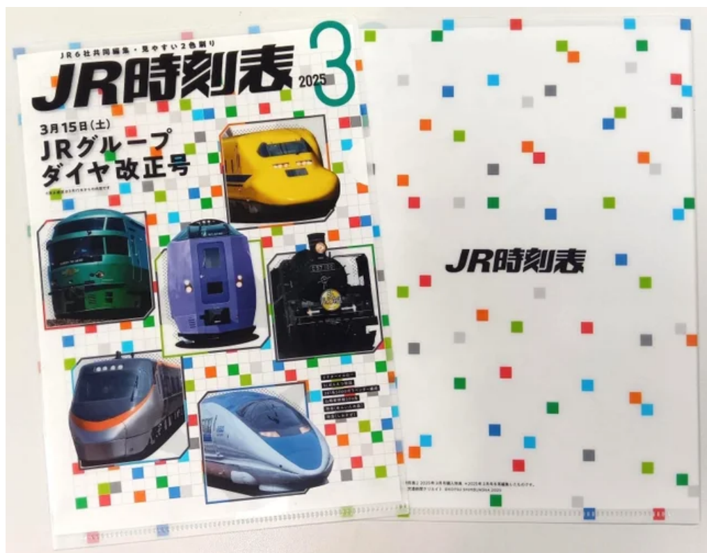
A5サイズオリジナルクリアファイル（表面／裏面）