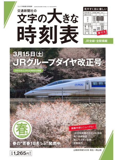
『文字の大きな時刻表』2025年春号