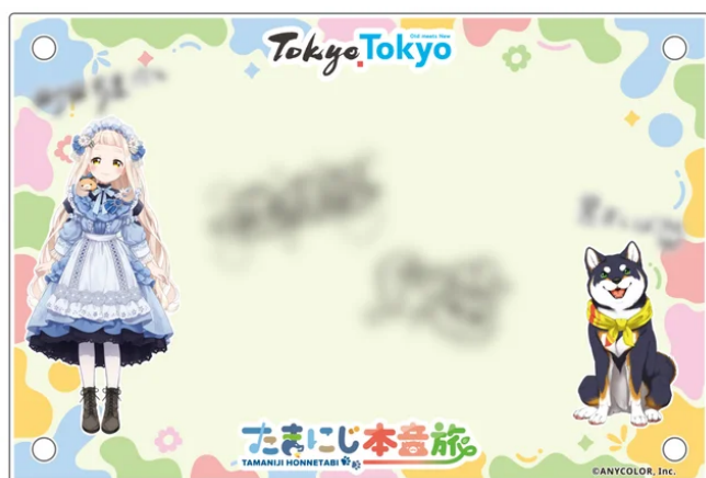
アクリルフォトスタンド（写真無しイメージ）

【抽選で20名様】 たまにじ本音旅 アクリルフォトスタンド（複製手書きメッセージ入り）