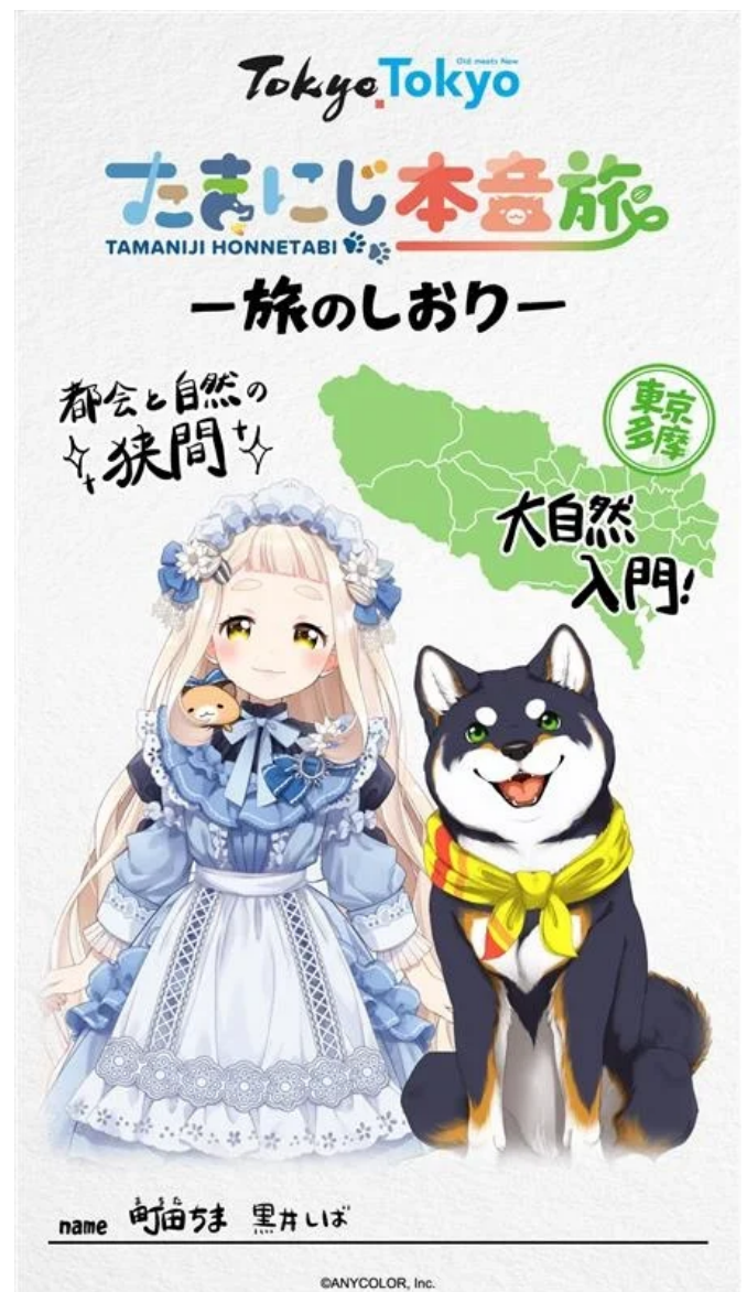
旅のしおり風画像

参加登録後、8つそれぞれのチェックインスポットにて、スマートフォンでGPSチェックインすると、デジタルスタンプが取得できます。