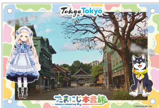
アクリルフォトスタンド（L判写真を入れたイメージ）