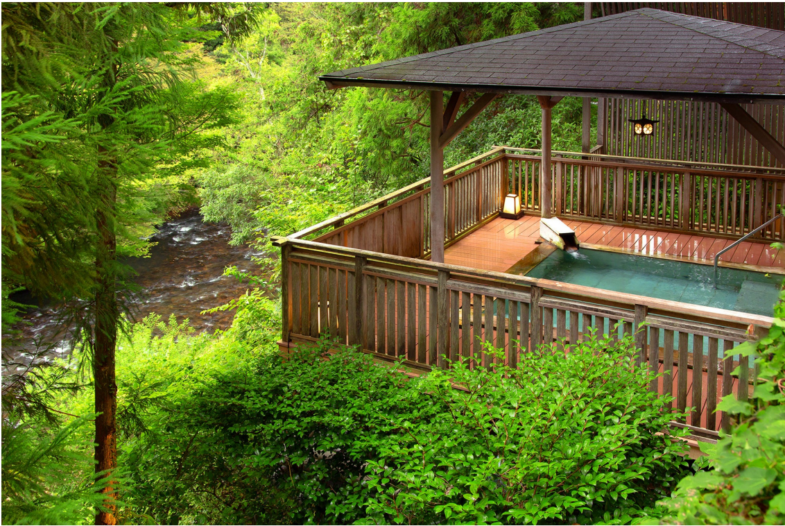
画像 吉祥やまなか