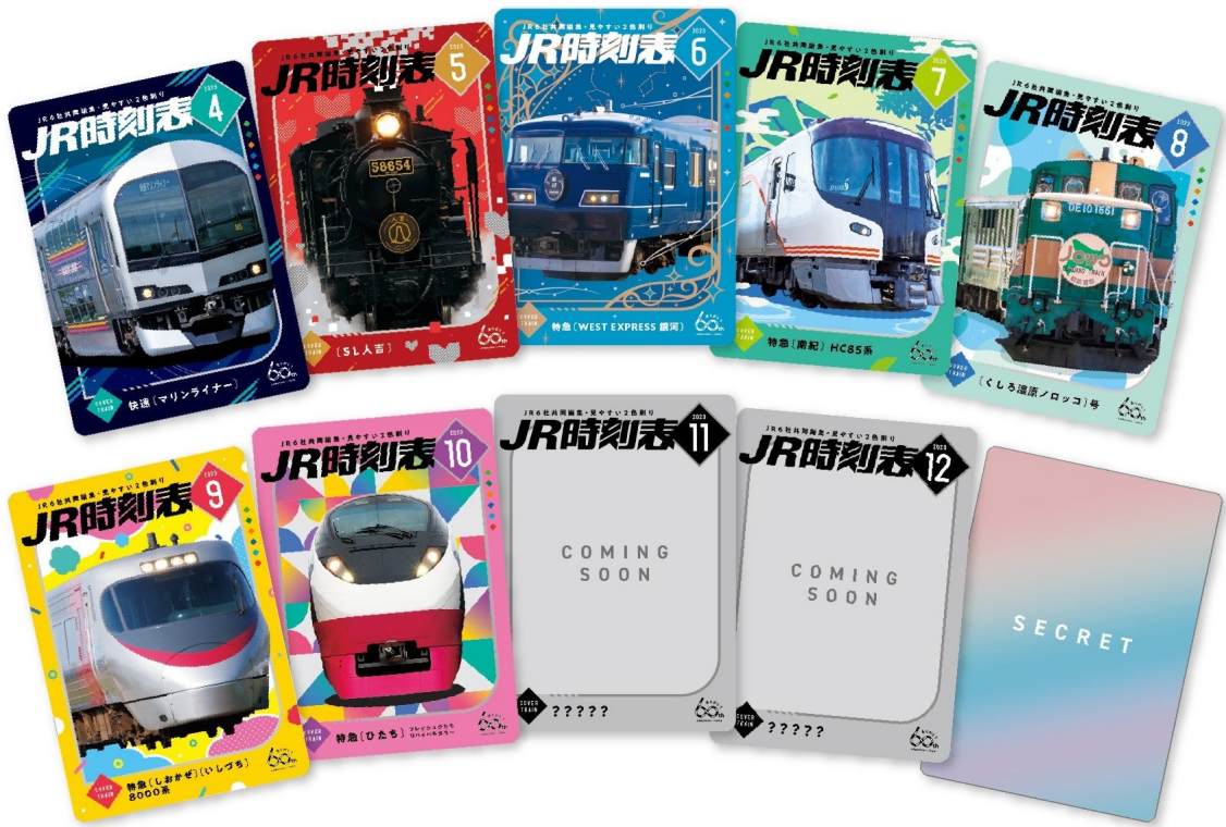
「時刻表60年」オリジナルトレーディングカード10枚セット 表面