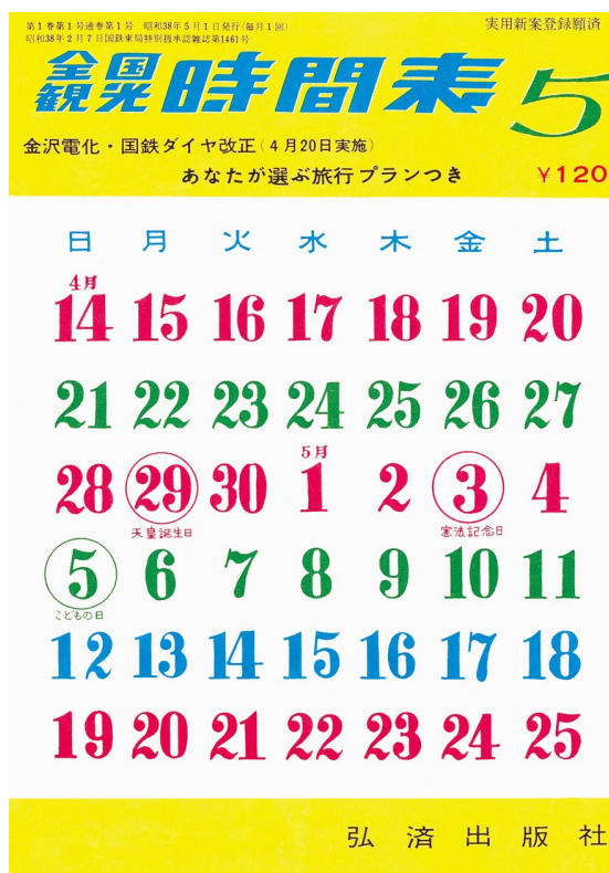
『全国観光時間表』1963年5月号