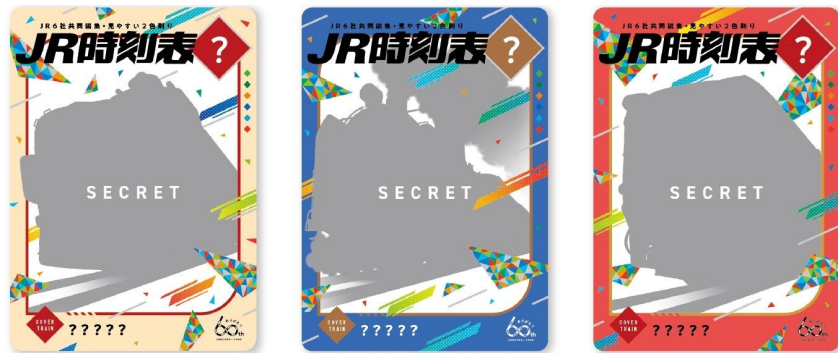
「時刻表60年」オリジナルトレーディングカード10枚セット シークレットカード (全3種)