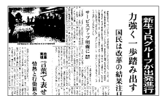
「交通新聞」1987年4月1日付