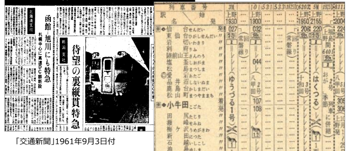
「交通新聞」1961年9月3日付