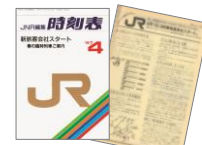
「JNR編集時刻表」1987年4月号

東北・上越新幹線開業、国鉄分割民営化、青函トンネル・瀬戸大橋の開通などの出来事を振り返ります。