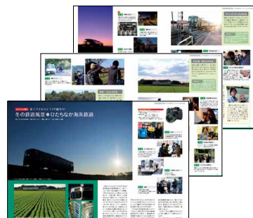
2020年4月号 富士フィルム様

クライアント様のご要望に沿って、読者への広告到達率を高めるタイアップ記事を編集いたします。編集部主導で、より強く読者に訴求するページに仕上げます。