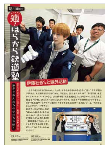
2024年11月号 専門学校 東京ホスピタリティ・アカデミー様